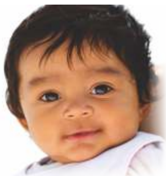
Face / चेहरा