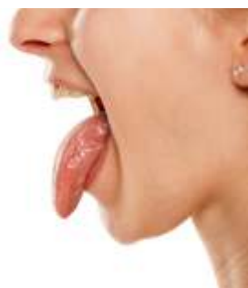
Tongue / जीभ