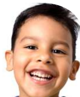
Teeth / दाँत

All parts of our body help us to do different things. This is what we do with our hands.