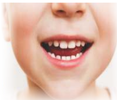
Mouth / मुँह